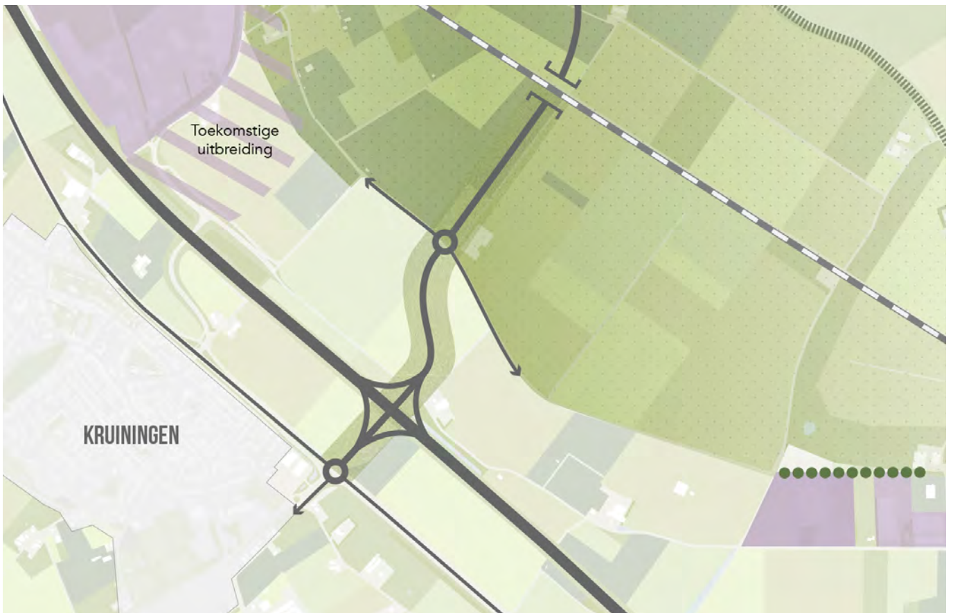
nieuwe volwaardige afslag Kruiningen - Yerseke