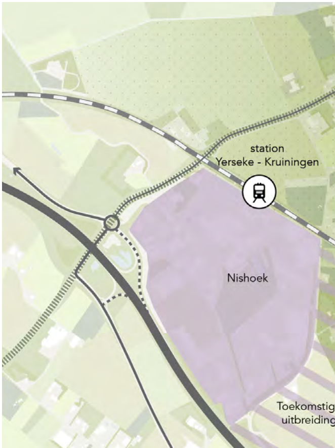
afwaarderen afslag Yerseke en Zanddijk